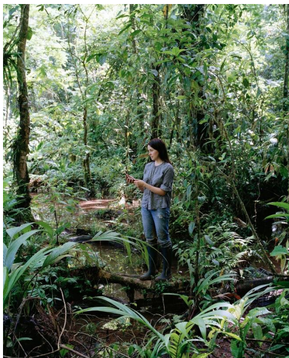
Sanna Kannisto, Densiometer , 2019 130x105 cm

avec le soutien de l'Ambassade de Finlande à Paris